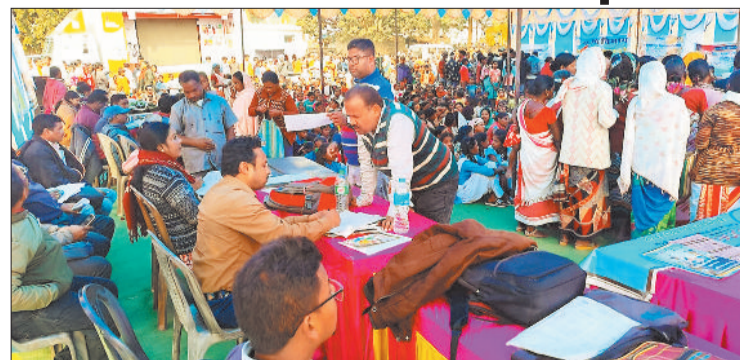
योजनाओं की जानकारी देते अधिकारी।

आम लोगों को केंद्र सरकार की जनकल्याणकारी योजनाओं के बारे में जागरूक करने और उन्हें उन योजनाओं का लाभ देने के उद्देश्य से शुरू की गई विकसित भारत संकल्प यात्रा जिले भर में जारी है। यात्रा के तहत शहर से लेकर गांव-कस्बों में शिविर आयोजित की जा रही है। इसी कड़ी में शुरुवार को जिले के कई ग्रामों में शिविर का आयोजन किया गया। जिसमें जनपद पंचायत जशपुर के ग्राम पंचायत पंडरसिली, ग्राम सोनक्यारी, कुनकुरी के ग्राम पंचायत कलिबा, ग्राम रजौटी, बगीचा के ग्राम पंचायत लोरा, ग्राम भादु, विकासखंड कांसाबेल के ग्राम पंचायत कोरंगा, ग्राम कटंगखार सहित अन्य ग्राम पंचायत शामिल हैं। जहां लोगों को यात्रा का उद्देश्य व केंद्र सरकार की प्राथमिकता वाली योजनाओं की