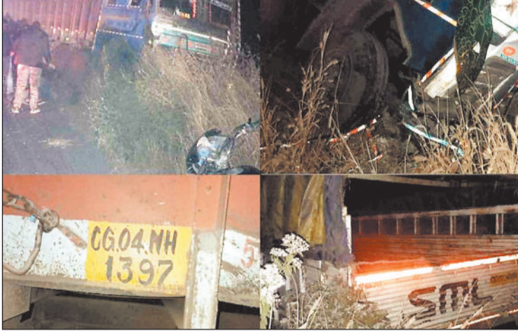
पिकअप और टुक की टक्कर के बाद दोनों वाहन क्षतिग्रस्त।

बताया जाता है यह हादसा इतना जबरदस्त था कि टुक की चपेट में आने से क्षतिग्रस्त पिकअप चालक समेत उसमें सवार 5 लोग बुरी तरह जख्मी होकर उसके भीतर फंसे रहे। सूचना मिलने पर एसपी व एडिशनल एसपी मौके पर पहुंचे और घायलों को बाहर निकाल अस्पताल भेजा जहां डाक्टरों जांच में दो को मृत घोषित कर दिया गया जबकि अन्य का इलाज जारी है। मृतकों की पहचान रायगढ़